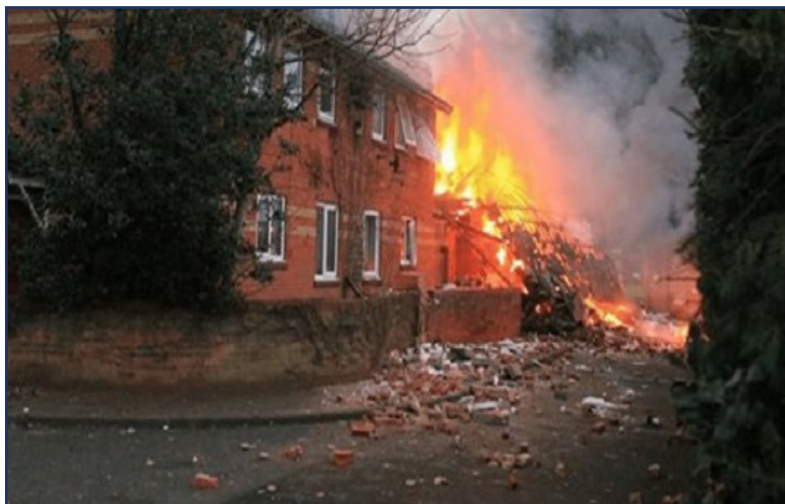
BOMBEN SOM EKSPLODERTE I TAPLAGUNG MENIGHET BLE LAGET AV EN HINDU EKSTREMIST GRUPPE.

Ekstreme grupper har skapt mange bevegelser for å true kristne. Målet deres er å få alle tilbake til Hinduismen. Disse radikale gruppene har fått flere pastorer og kristne i varetekt. Syv personer ble arrestert midten av mai i Tapeljung og tre personer ble satt i fengsel i Katmandu uken etter. Den 11 mai kom den Indiske statsministeren på besøk til tre religiøse hovedsteder og fortsetter å promotere hinduisme i Nepal. Han er en veldig stor brikke i forfølgelsen. Den 13 mai ble to kirker offer for bombe eksplosjon. Takk Gud at ingen ble skadet. Alt dette er bare toppen av isfjellet av det som skjer i Nepal akkurat nå. Kristne tar hver dag en bestemmelse for å ta opp sitt kors og der er stor Hindu bevegelser, vold og aksjoner mot dem hver dag. Over 15 personer er i varetekt fordi de har fortalt noen evangeliet. Husk å be for Nepal.