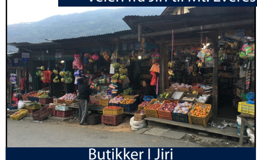
Butikker I Jiri