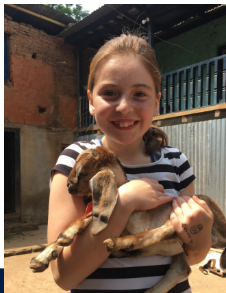
Knall kjekt med geite killinger!