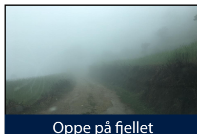
Oppe på fjellet