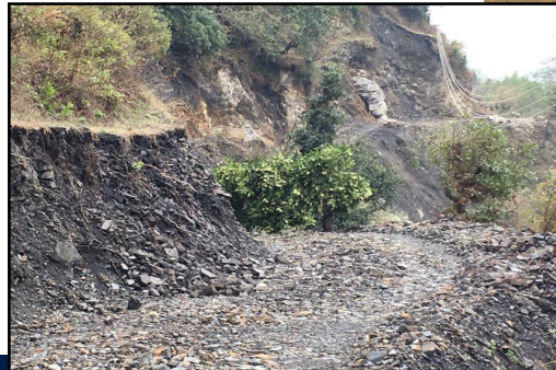
Deler av landsby veien