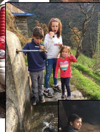
Landsby livet; morgenstell og te ved bålet