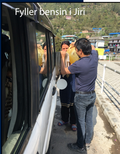
Fyller bensin i Jiri

Dagen etter kjørte vi til Dhulikhel hvor vi ble ett par netter for å sove ut etter eventyret. Vi fikk også besøkt litt familie i landsbyen der. Barna bar rundt på geiter og lekte med hunden før vi reiste hjem til Katmandu.