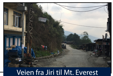
Veien fra Jiri til Mt. Everest