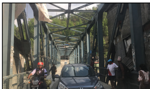
En av de beste bruene, men hadde bare plass til en bil om gangen