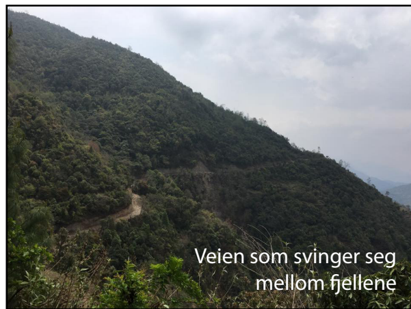
Veien som svinger seg mellom fjellene

Dagen etter kjørte vi til Dhulikhel hvor vi ble ett par netter for å sove ut etter eventyret. Vi fikk også besøkt litt familie i landsbyen der. Barna bar rundt på geiter og lekte med hunden før vi reiste hjem til Katmandu.