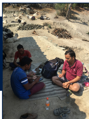
Her hviler vi litt før vi skal gå videre Veien til høyre var akkurat åpnet