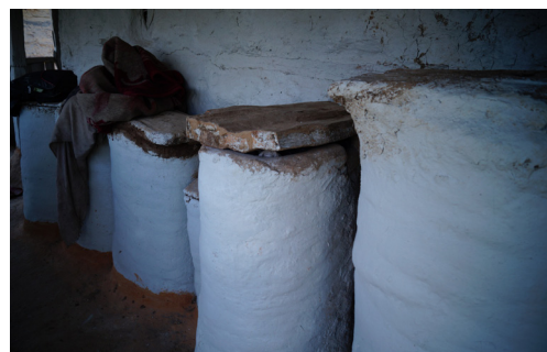
Mat og vann lagring