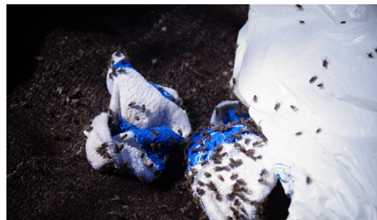
Fluer over alt! men maten var kjempe god!

Jeg fortsatte å ha problemer med høyre foten min og smertestillende gav ingen lindring, så på dag to bestemte vi oss for, sakte men sikkert, å gå tilbake til sivilisasjonen. På veien tilbake fra dette nydelige stedet, måtte jeg bruke både armer og ben. Ett skritt i feil retning ville koste meg livet. Jeg klarte ikke å stå på foten så jeg hadde noen som støttet meg på begge sider.