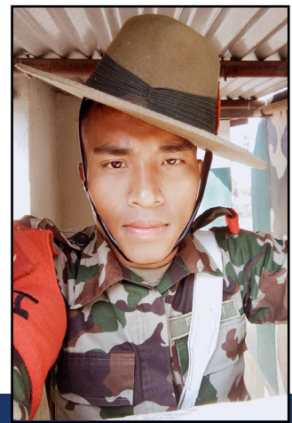
Tirtha er også i militæret