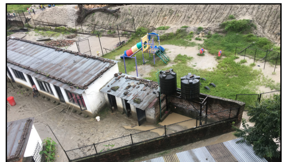
Dette var slik det så ut før de bygget muren. Du kan se de store jordmassene.