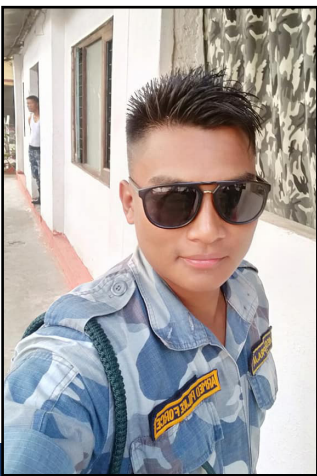
Umesh er politi

Tusen takk for støtten til disse barna. Du forandrer verden, ett liv om gangen!