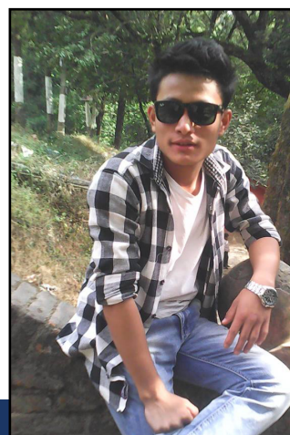
Gaurab jobber fulltid og hjelper til i menigheten