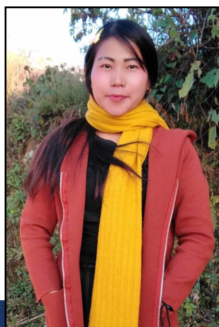
Prtit er snart ferdig å studere