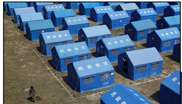
Karantene camp for korona

Igjennom din hjelp har mange av disse menneskene fått mat og omsorg. Tusen takk for det du har gitt!