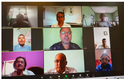
Zoom har vært til stor hjelp slik at vi kan holde kontakten