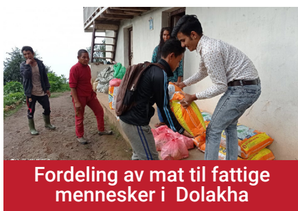
Fordeling av mat til fattige mennesker i Dolakha