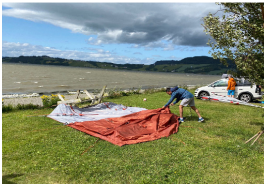
Prøve å redde teltet