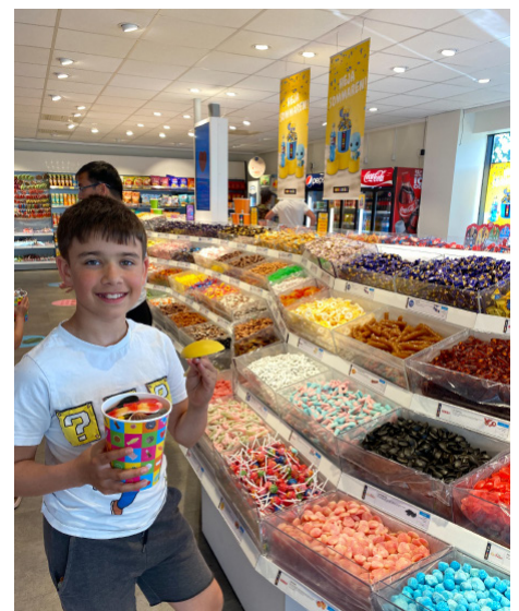
Samuel handler "godis" i Sverige.