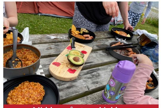
Middag på stormkjøkken

Tusen takk for bønn og støtte i alle disse årene. Det betyr uendelig mye for oss!