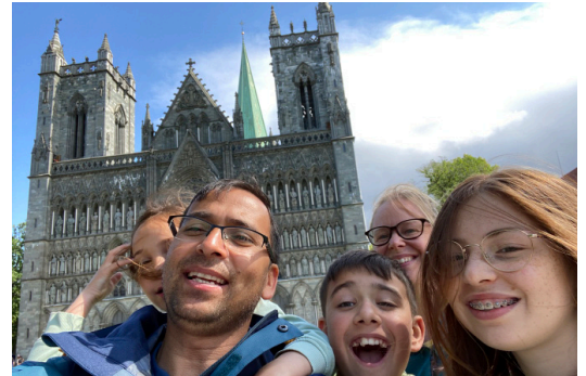
Nidarosdomen i Trondheim