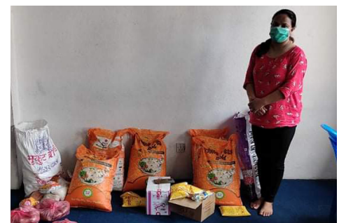
Menighetene har lagret mat til som trenger det mest