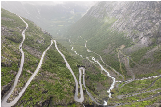
Kjente fjellveier i Norge