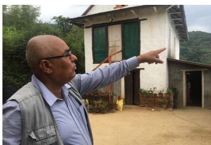
Lokmani viser meg rundt i landsbyen