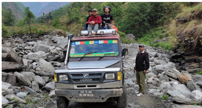
Hele teamet på vei fra Dhading Besi til Tisimarang